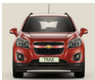
Nouveau Chevrolet Trax

Le SUV connecté : profitez de tous vos contenus multimédias partout et à tout moment.