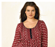
Grandes Tailles LaRedoute

Le SUV connecté : profitez de tous vos contenus multimédias partout et à tout moment.