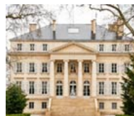
Investir dans le vin

Les tendances Grandes tailles de la saison à prix imbattables, une livraison en 24h !