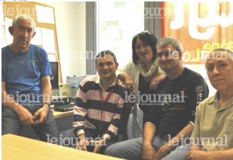
La CGT alerte sur la situation financière des Ehpads qui auront un déficit dépassant le million d'euros à la fin de l'exercice 2013.

le 08/10/2013 à 05:00 | Grégory Jacob Vu 148 fois