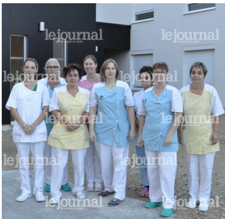
Les salariées des « Iris » de permanence ce jeudi 31 octobre devant le bâtiment neuf de l'Ehpad, sorti de terre en juin 2003, mais qui n'a jamais servi faute de mobilier.

le 01/11/2013 à 07:00 | Camille Roux Vu 4154 fois