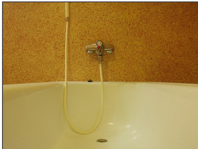
Une baignoire

Première semaine du premier stage. Je l'avoue, j'avais un peu peur. Pas des personnes âgées, non, au contraire ça me rassurait de commencer par un EHPAD (Etablissement d'hébergement pour personnes âgées dépendantes). Non, LE truc qui me faisait flipper, c'était l'équipe. Parce que faut pas rêver hein, chez les aides-soignantes, il y a surtout des filles. Donc des équipes de filles. Et patati et patata, et blablabla et blablabla.